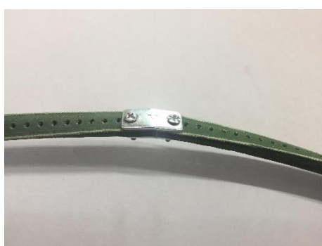
a) Sprawdź naciąg paska