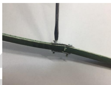
b) Odkręć jedną śrubę, a drugą poluzuj