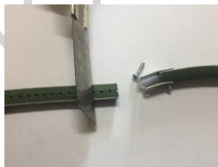
d) Skróć pasek o wymaganą liczbę segmentów