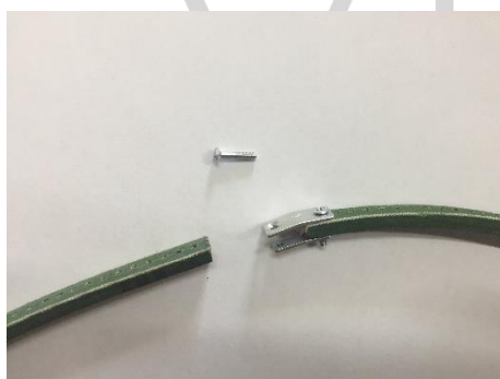
c) Rozłącz pasek