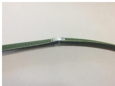
f) Ponownie sprawdź naciąg paska